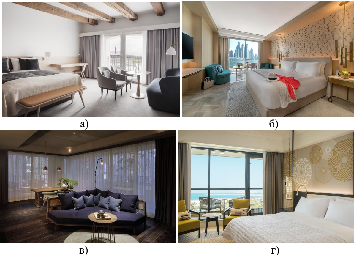
Рис. 1. Приклад акцентного прийому використання етнічних мотивів:

сервіз для традиційної японської церемонії чаювання на (рис.1 (в)), світильники в східному стилі та використання традиційних орнаментів в оздобленні стін на (рис.1 (г)). Цей прийом дає можливість представити елемент національної культури максимально виразним у просторі та поєднати сучасне світосприйняття з історичним культурним надбанням певної території.