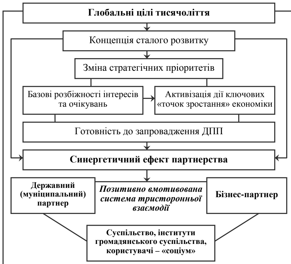
Рис. 2. Синергетична модель тресторонньої взаємодії ІГС, держави й бізнес-суб'єктів при реалізації проектів державно-приватного партнерства, спрямованих на реалізацію цілей сталого розвитку [7]