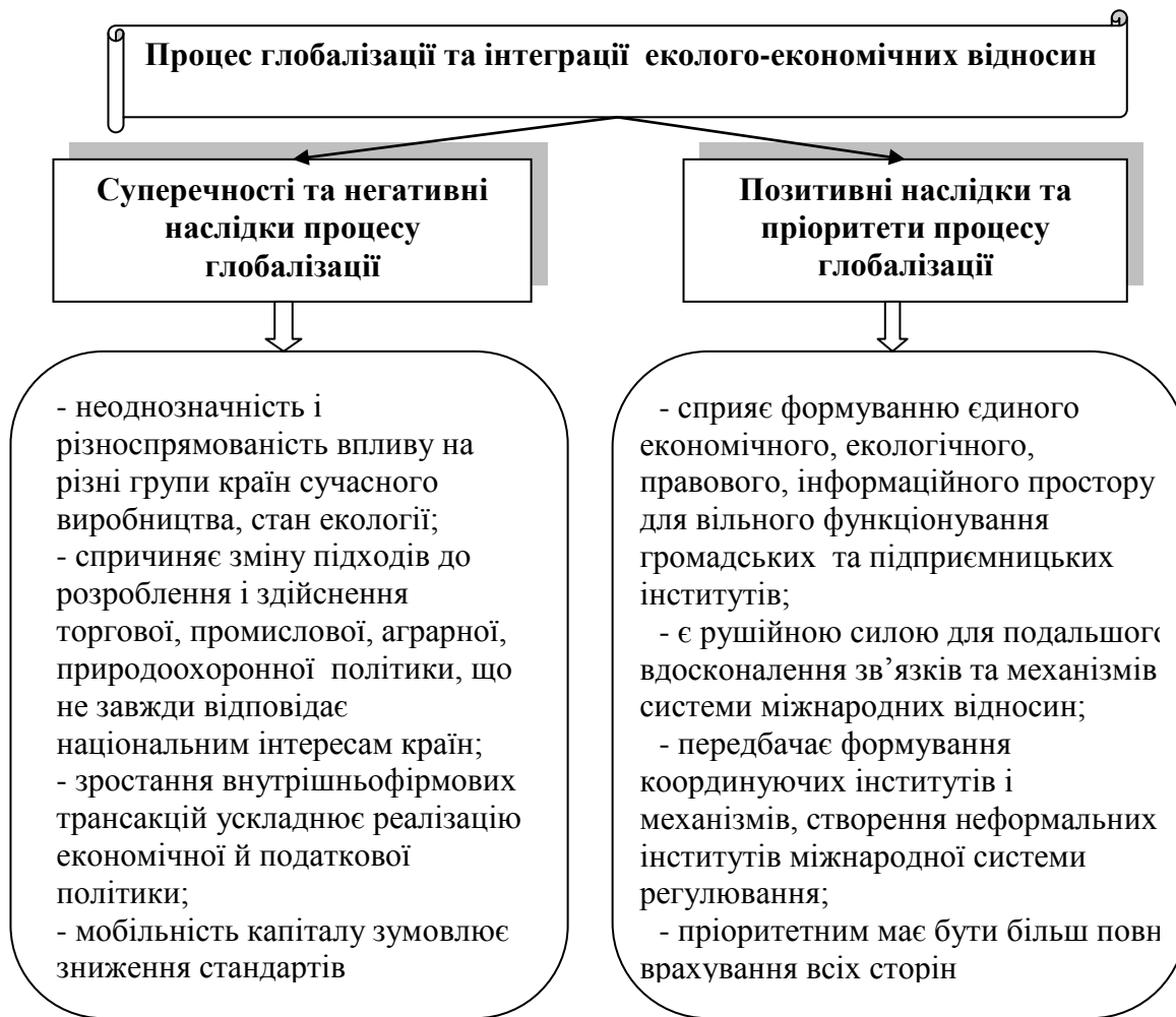
Рис. 1. Суперечності та перспективи процесу глобалізації та інтеграції в системі еколого-економічних відносин

підприємницької та природоохоронної сфери. Виходячи з цього можна констатувати, що міжнародна природоохоронна діяльність, поряд з економічною інтеграцією має бути базисом процесу глобалізації та сприяти: розвитку практики міждержавних угод природоохоронного характеру; формуванню координуючих інститутів і механізмів цієї сфери; недержавних структур та неформальних інститутів узгодженої міжнародної системи регулювання сфери природокористування; застосуванню спеціальних економічних важелів та інструментів.