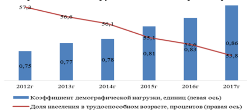
Рис. 3 Коэффициент демографической нагрузки и доля населения в трудоспособном возрасте в муниципальном районе Исаклинском 2012-2017 гг.

В общей численности населения района более 30 процентов 4973 человека составляют лица старше трудоспособного возраста, 2860 моложе трудоспособного возраста и 7597 в трудоспособном возрасте, (рис.3).