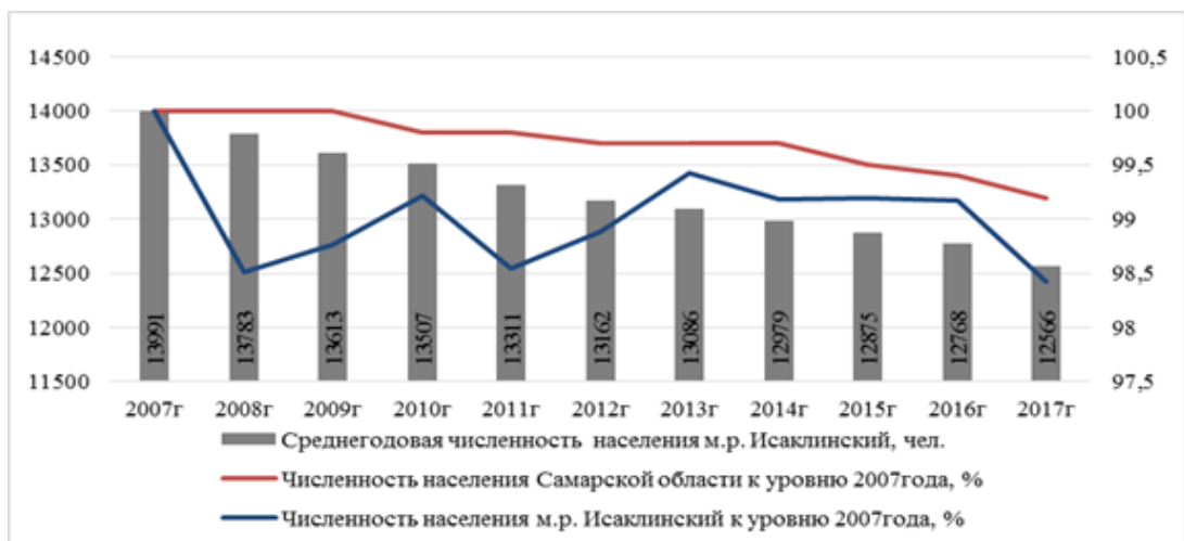
Рис.1 Численность населения м.р. Исаклинский в 2007-2017 гг., динамика численности населения Самарской области в аналогичный период

В районе живут 37 наций и народностей, из них русские – 36,6%, чувашаи – 37,8%, мордва – 19,5%, татары – 2,7%, украинцы – 1,8%., представлены на рис.2.