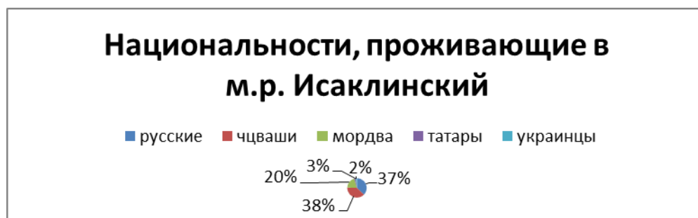
Рис.2 Национальности, проживающие в м.р. Исаклинский Самарской области

В районе живут 37 наций и народностей, из них русские – 36,6%, чувашаи – 37,8%, мордва – 19,5%, татары – 2,7%, украинцы – 1,8%., представлены на рис.2.