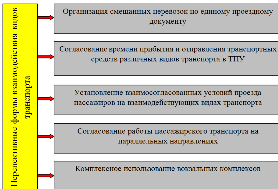
Рис. 1. Перспективы развития взаимодействия видов транспорта в транспортном узле

Улучшение обслуживания пассажиров в транспортно-пересадочных узлах может быть достигнуто путем согласования графиков и расписаний движения различных видов транспорта, внедрения единых проездных документов в рамках цифровых информационных технологий [4] (рис.1).