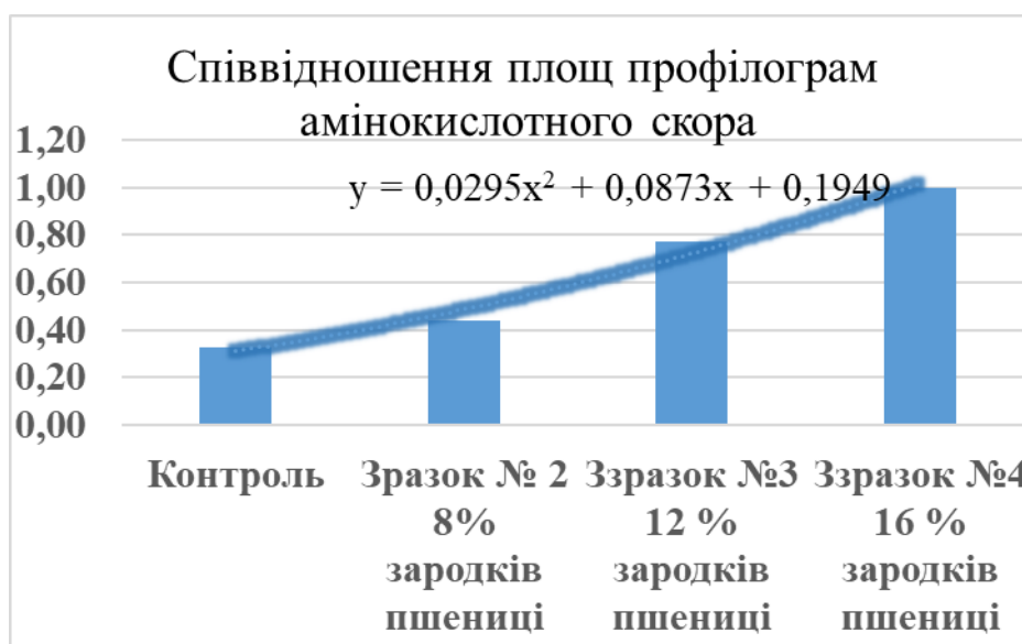
Рис. 3 Співвідношення площ профілограм амінокислотного скоря Авторська розробка