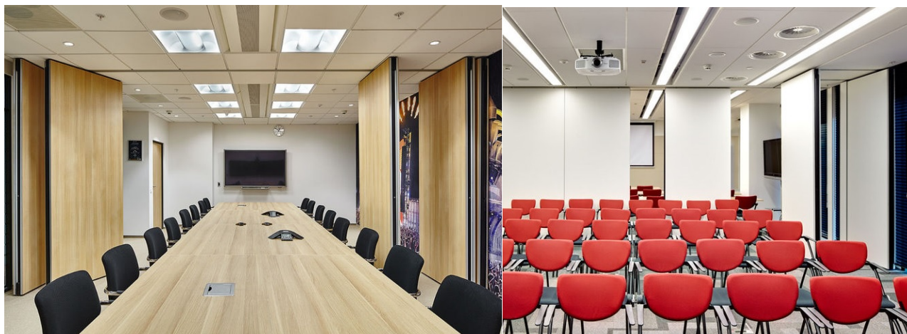
Рис. 1. Приклад розсувних стін SmartWall

Для зручного зонування єдиного простору конференц-залу можна запропонувати використання стін SmartWall (рис. 1).