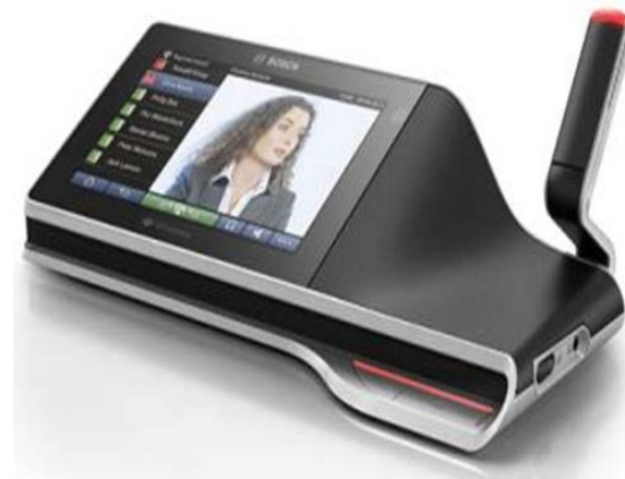
Рис. 3. Мультимедійний пристрій DCN-multimedia

використання різних форматів даних істотно підвищує рівень залученості учасників заходу.