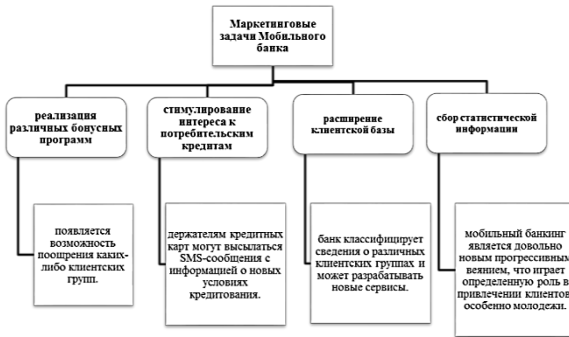
Рисунок 3. Маркетинговые задачи мобильного банкинга 4

Эксперты дают положительные прогнозы по использованию систем war-банкинга, поскольку так обеспечивается максимальный уровень удобства для клиента. Следует отметить, что мобильный банкинг направлен не только на решение основных задач. К нему также предъявляются определенные требования для решения маркетинговых задач (рис. 3).