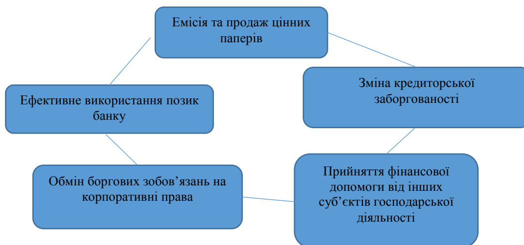
Рис.3 Оздоровлення підприємства

Форми санації визначені в Законі України “Про відновлення платоспроможності або визнання його банкрутом”. Альтернативні санаційні заходи та їх форми дозволяють планувати санаційну процедуру, тому аудитор може запропонувати наступні оздоровчі заходи: (рис.3):