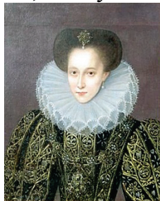
Рис. 3 «Портрет Марии Стюарт, 1561 г.»

Наиболее известная модель - воротник «Стюарт», появившийся в 16 веке и названный так в честь шотландской королевы Марии Стюарт (рис. 3). Его размер мог варьироваться разными диаметрами: от небольших, едва выходящих за границу подбородка, до массивных, выступающих за линию плеч.