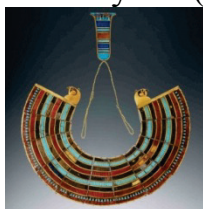
Рис. 2 «Ускх Тутанхамона»

Но история ожерелья-воротника уходит дальше в века: первые его виды существовали еще в Древнем Египте. Крупное украшение, состоящее из нескольких рядов бусин или пластин, настолько массивное, что закрывало своим объемом грудь и плечи, называлось ускх (рис. 2).