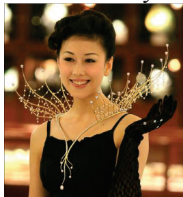
Рис. 6 «Splendid Night»

впервые было представлено на выставке жемчуга в городе Цзинань, Китай. Оно представляет собой золотые побеги с капельками росы, нанизанными на паутинку. Изящное украшение подойдет не только для подиумных показов, но и в качестве аксессуара для торжественного случая.