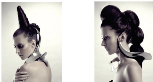
Рис. 8 «Воротники из никеля, Ханвен Шен»

Футуристические варианты ожерелья-воротника все меньше напоминают воротник классический. Такова коллекция дизайнера из Китая, Ханвен Шена, сделанная из черного никеля (рис. 8, 9). Нарушенная симметрия, плавные, не свойственные привычным украшениям формы, сочетающиеся с жесткими ребрами и остроконечностью, игра света на отполированном металле - все это вместе создает ощущение чего-то космического, загадочного. В коллекции отсутствуют дополнительные средства украшения: инкрустация, чеканка, гравировка - только текучесть и цвет металла, и главное - нетипичная форма не кажется чем-то инородным на модели и выглядит органично, хотя и создает ощущение чего-то опасного.