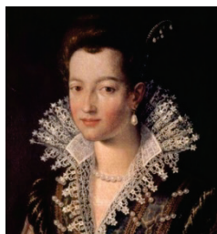
Рис. 4 «Портрет Марии Медичи, Санти ди Тито»

веерообразный воротник на проволочном каркасе, окаймляющий вырез женского платья. Для его изготовления обычно использовали прозрачные, изящные ткани, кружево, тюль или гипюр зачастую белого цвета, а его праздничные, торжественные вариации украшали золотыми нитями или жемчугом.