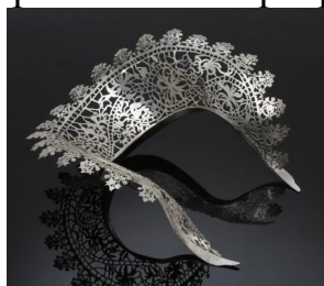
Рис. 5 «Ожерелье-воротник, Шарон Хелганс»

Начнем с украшения, близкого к традиционному - работы зарубежного автора - Шарона Хелганса (рис. 5). Он создал серию воротников, которые повторяют витиеватый ажур кружева, при этом выглядят достаточно легко и воздушно, хотя выполнены из стерлингового серебра.